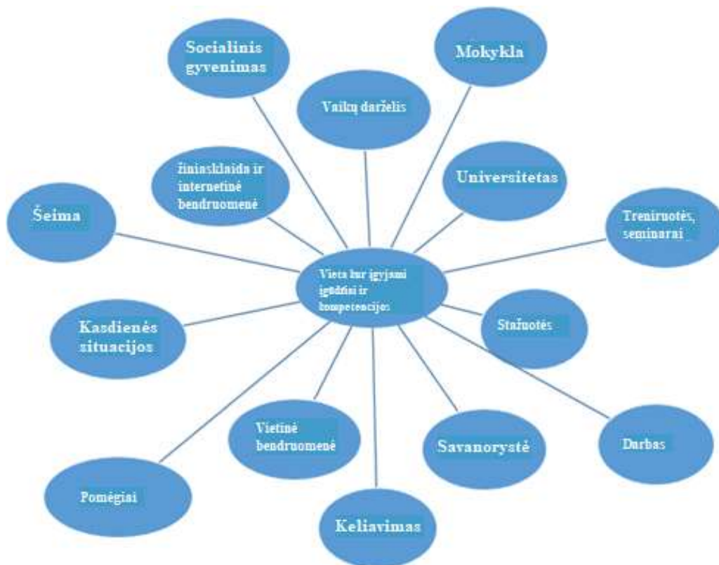
1 pav. Žemėlapis, kaip/kur įgyti įgūdžių