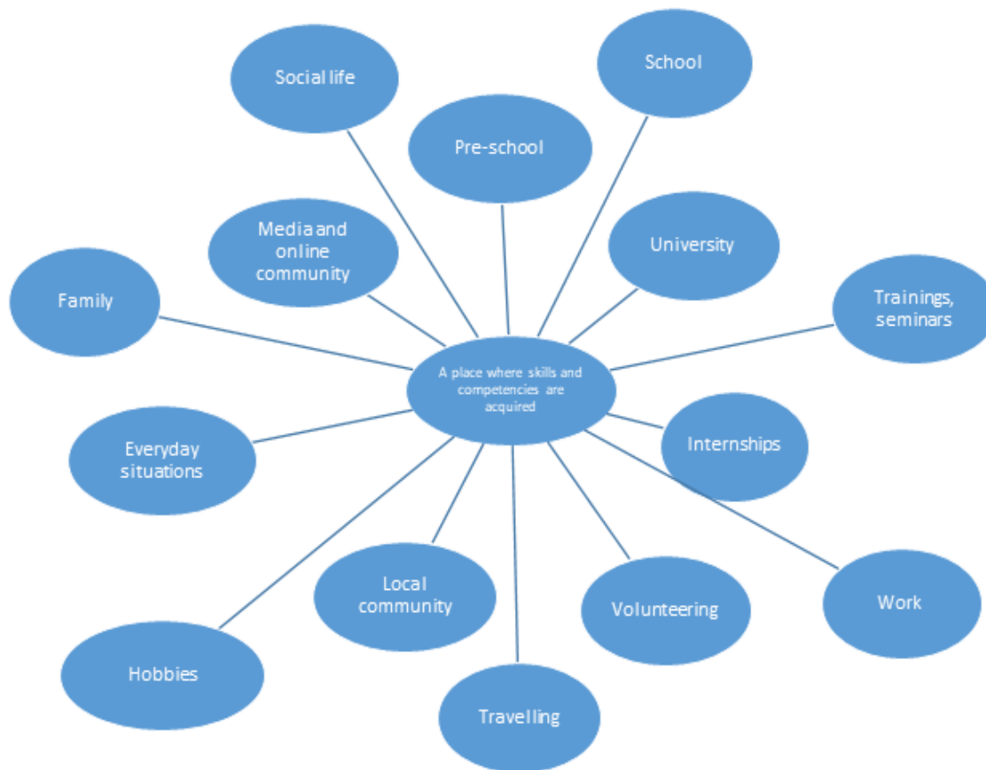
Фиг. 1 Карта как/къде да получим умения

„Тъй като ситуацията се променя радикално през 21-ви век, ние като човечеството навлизаме в криза, което както в социалния, така и в личния живот означава едно просто нещо – ситуация, за която нямаме предварително подготвени решения. Създаването на нови, нестандартни, неподготвени решения на ново предизвикателство изисква креативност, която трябва да се насърчава.”