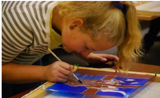
Figura 3. Centro di creatività tecnica degli studenti e delle studentesse, Studio di pittura su seta (2016), Kaunas, Pittura su seta